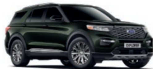
Verde Forged (No disponible)