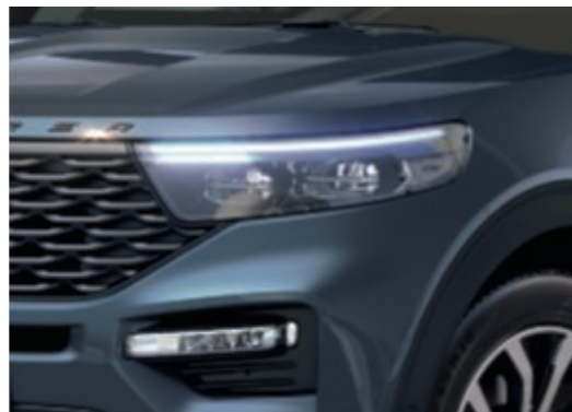
Faros LED con tratamiento de camuflaje deportivo.