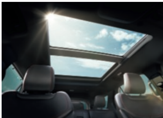
Techo panorámico eléctrico de dos paneles.